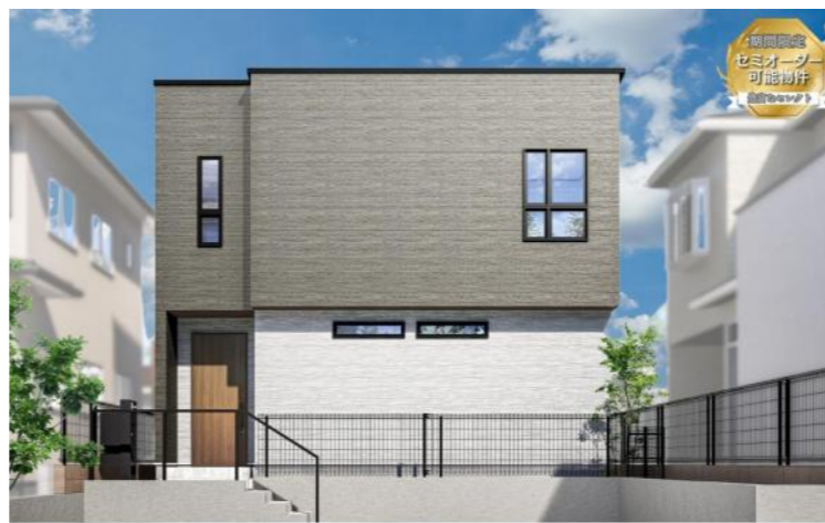
人気の中居町限定1邸。商業施設充実エリア