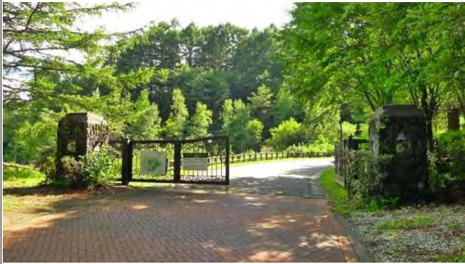
旧軽井沢倶楽部別荘地入口ゲート

ゲートコミュニティの旧軽井沢倶楽部別荘地:小川が隣接する2,023㎡(約611坪)の土地です。