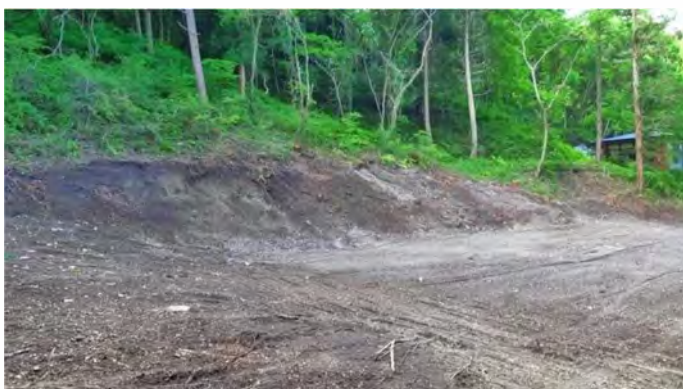
敷地内(北側を望む)