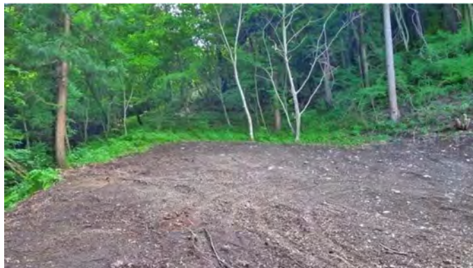
敷地内(西側保存緑地側を望む)