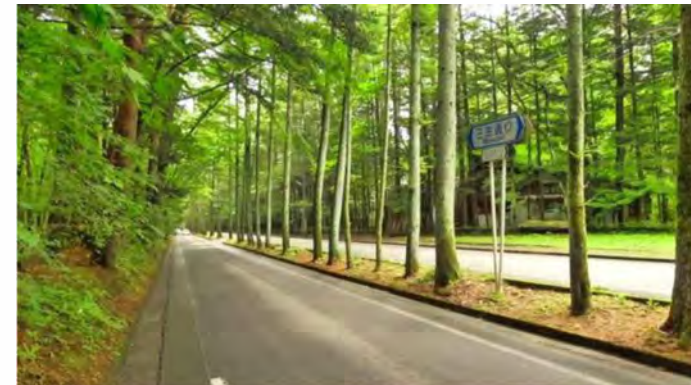
三笠並木通りまで徒歩約13分(約1km)