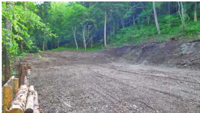
敷地内(西側を望む)