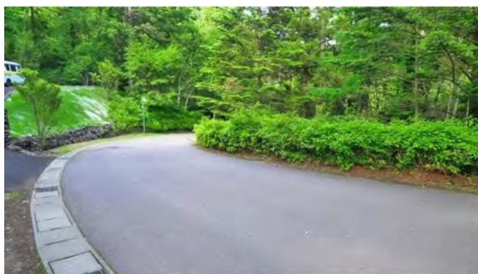
前面道路(南側を望む)