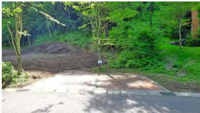
敷地東側インターロッキングブロックで舗装されたカースペース