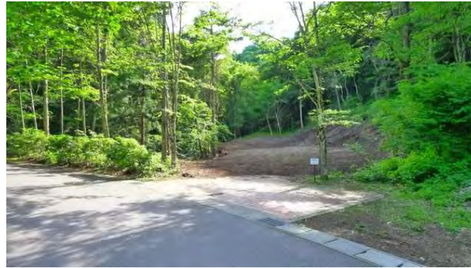
道路から見た敷地(南西側を望む)