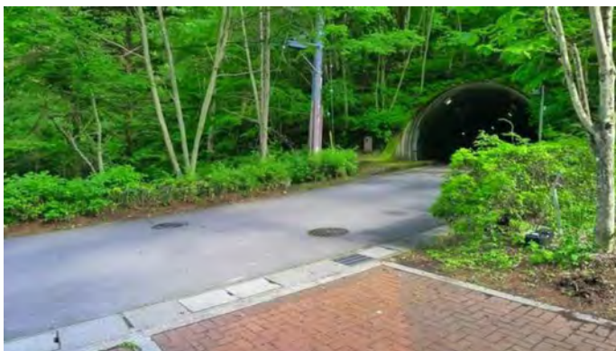
敷地から見た道路(南東側を望む)