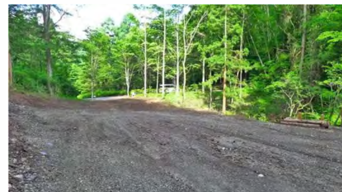
敷地内(東側を望む)