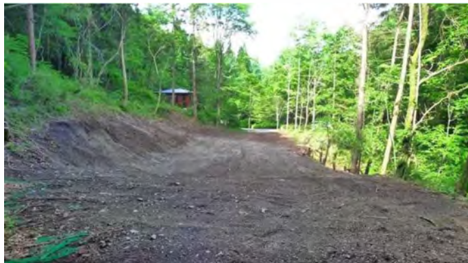
敷地内(道路側を望む)