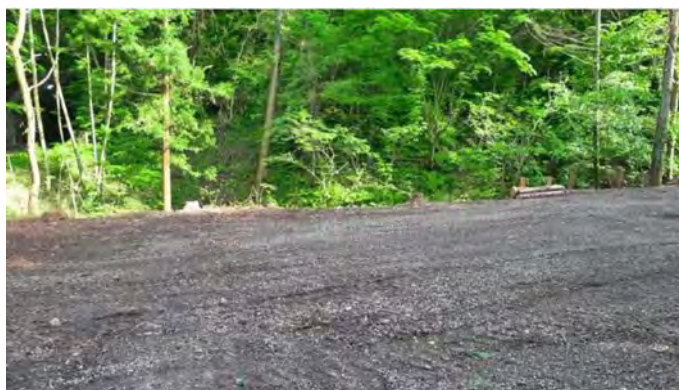
敷地内(南側を望む)