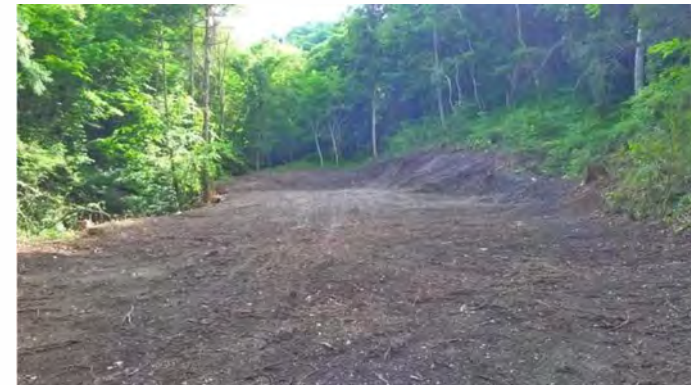
敷地内(西側から撮影)