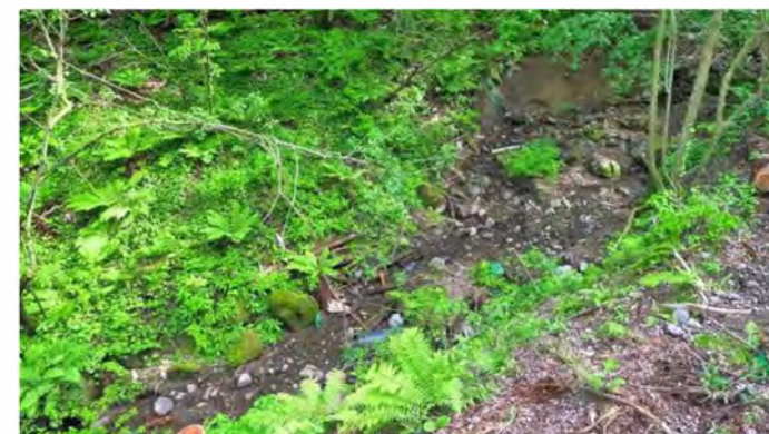
隣接した小川(南側を望む)