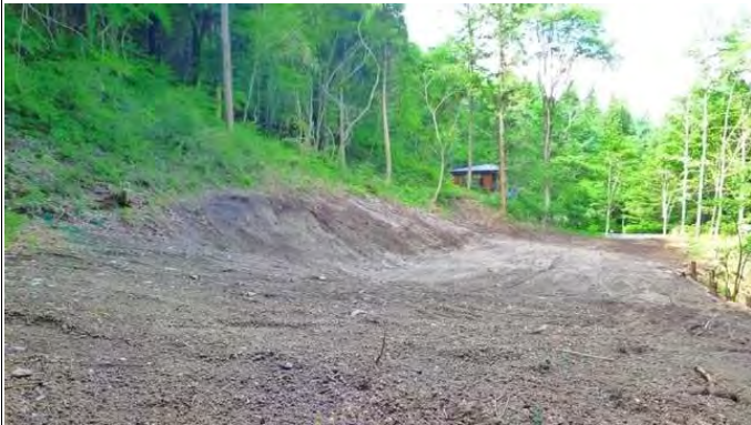
敷地内(道路側を望む)